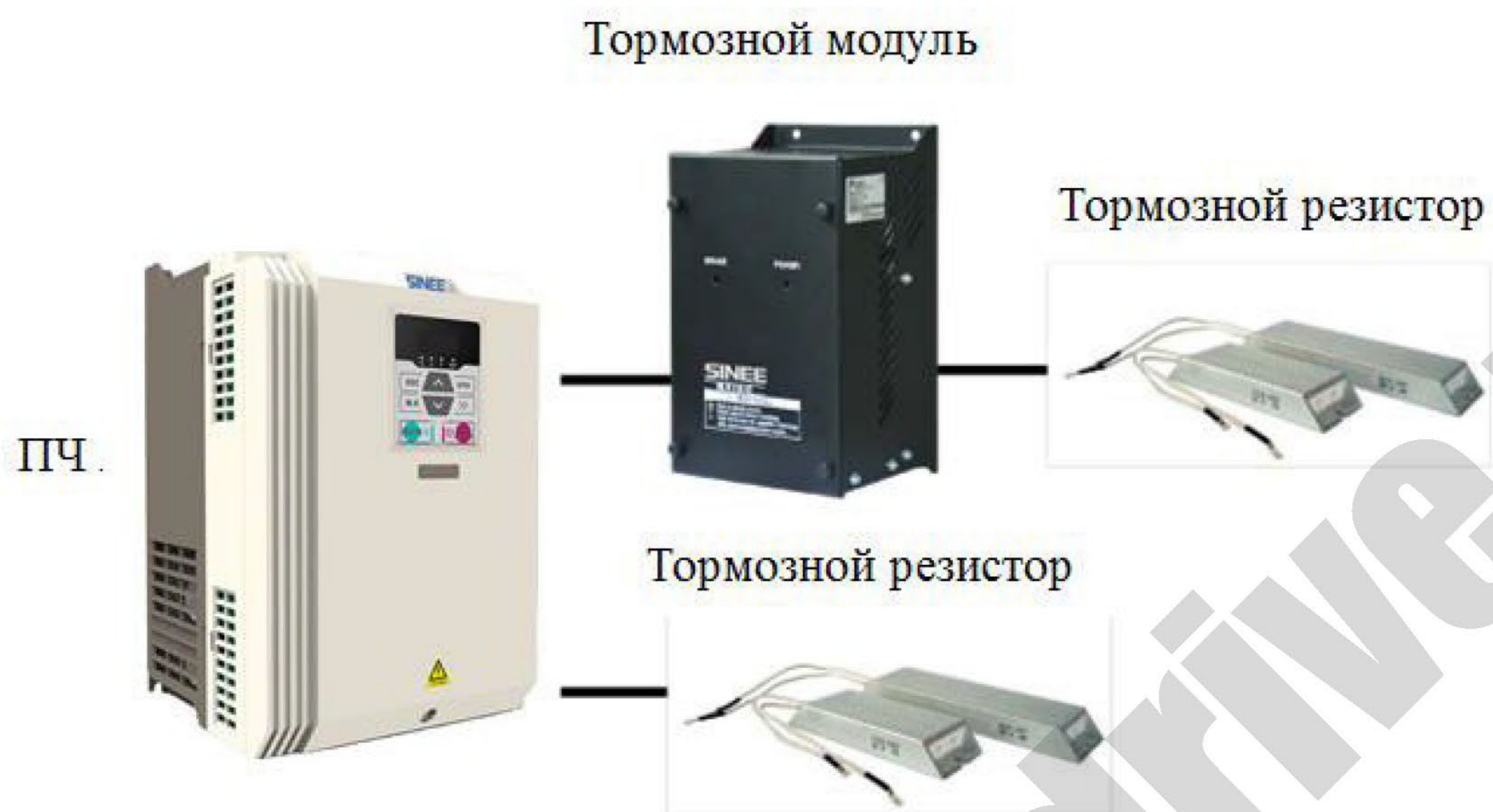
Рис. 3 Два варианта подключения тормозного резистора к преобразователю частоты (ПЧ)