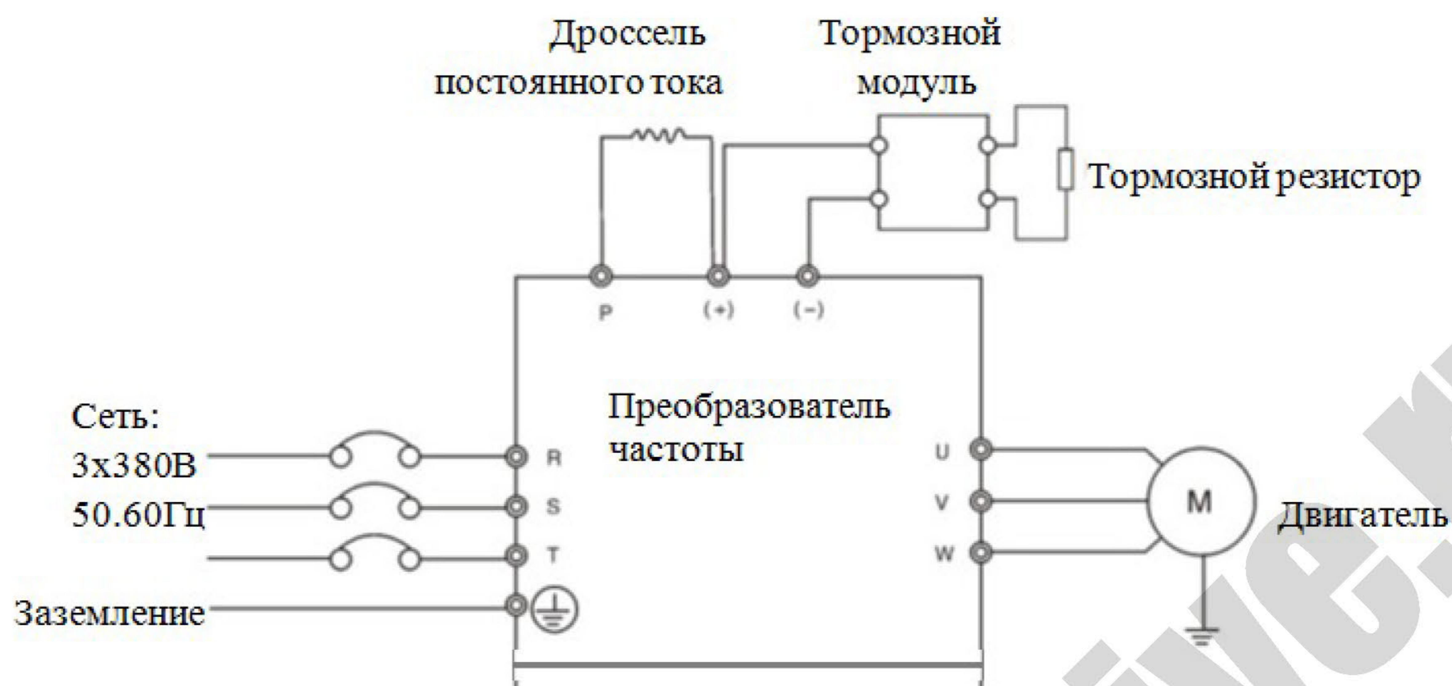
Рис. 5 Схема подключения тормозного резистора к преобразователю частоты через тормозной модуль (средние и большие мощности ПЧ)