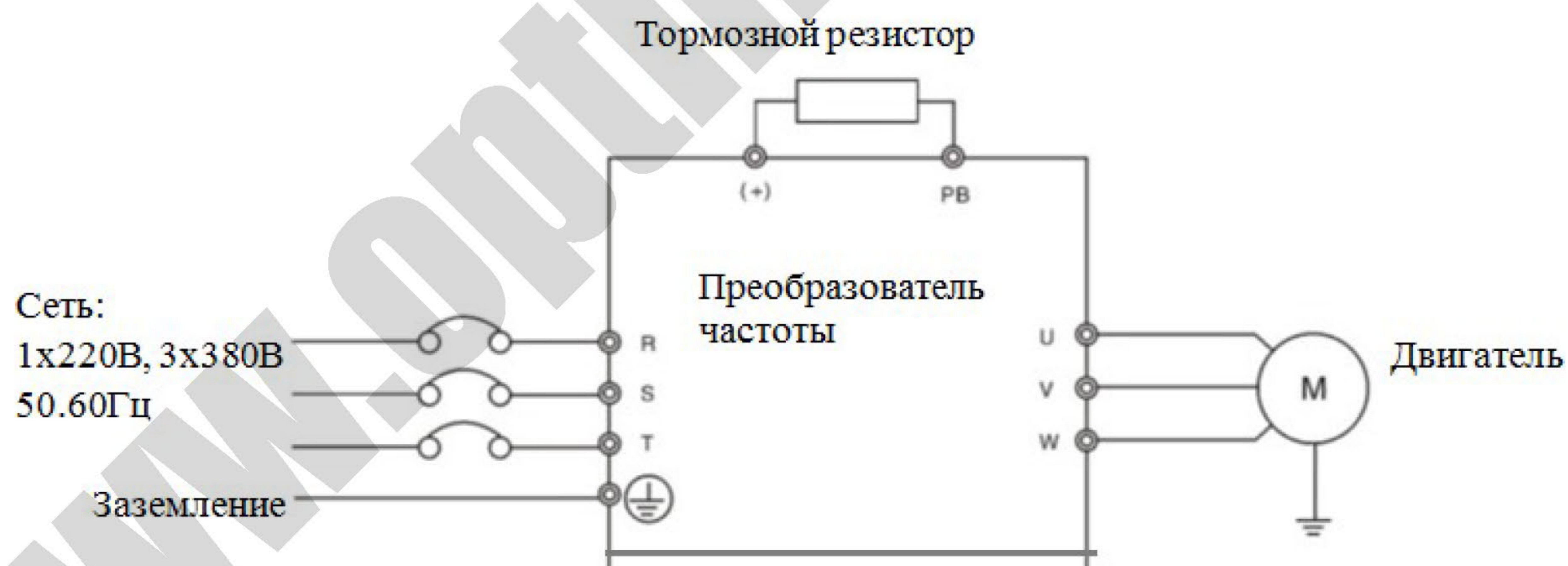
Рис. 4 Схема подключения тормозного резистора к преобразователю частоты напрямую (малые мощности ПЧ)